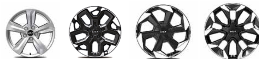
Легкосплавные диски 17"