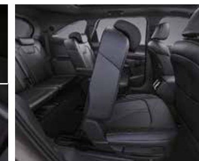
Облегченная система входа на второй ряд одним нажатием кнопки