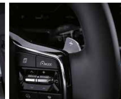
Подрулевые «лепестки» переключения передач