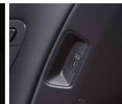
Дополнительные зарядные устройства USB в спинках сидений первого ряда